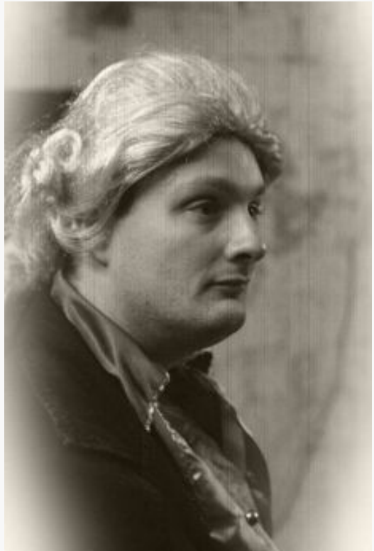
Le gouverneur Alessandro del Bianchini dont la légitimité est aujourd'hui contestée.

Le problème commence il y a près de trois ans quand Alessandro del Bianchini accède à la fonction de gouverneur après avoir remporté la partie de poker de l'an 308. Jusque-là rien d'anormal me direz-vous, on a bien parlé de triche et de combines douteuses lors de la partie mais donc rien d'anormal. L'année suivante le Conseil Blanc, noble porte-parole de la voie de l'Oracle décréta que la partie de poker serait désormais bisannuelle. Bien que beaucoup se posèrent la question de l'ingérence du conseil dans une cité où la loi de l'Oracle n'est donc pas censée avoir cour, la pilule est plutôt bien passée. Voilà donc notre cher gouverneur del Bianchini reparti pour une seconde année d'exercice. Tous les ambitieux de la cité attendirent donc la fête de l'Oracle de 310 avec impatience. Et ils attendirent longtemps puisque nul ne vit l'Oracle en cette sombre année.