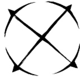
La marque des bannis – signe honte devenue symbole d'un peuple

Nos informateurs au sein de différents clans nous ont quant à eux rapporté que la question de la direction de la Fédération des Sans-mâtres serait un point de tension important entre le clan Kaldérash, qui se considère visiblement comme le leader naturel du mouvement d'unification et le plus légitime politiquement, et le clan Lovara. Ishbert Rajik aurait d'ailleurs déclaré en toute humilité « Si les Sans-mâtres doivent avoir un chef unique il leur faudra quelqu'un dont le charisme, la force mentale et la vivacité d'esprit soient à la mesure de ce grand peuple. Il leur faudra quelqu'un comme moi. »