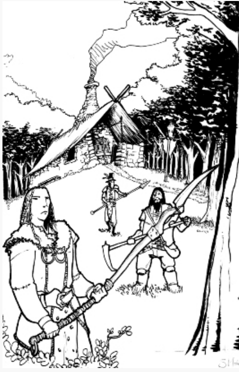
Lieu de résidence typique sans-mâitre