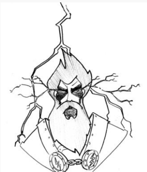
Croquis de l'archange apparu à Marchev par un de nos correspondants

Ayant eu la chance de me trouver non loin du rituel, j'ai pu entendre et ressentir une partie de ce qu'ont ressenti les Èrés présents. L'archange a, par sa seule présence, plongé l'ensemble de l'assemblée dans une fureur fanatique. Il leur a donc ordonné de s'armer afin de lancer une croisade sur les Damnés! Il s'agit de la première croisade qui aura lieu sur Erèbe (plusieurs auraient eu lieu dans l'ancien monde bien que les références historiques soient floues). En effet, la cité de Marchev est, depuis le départ des troupes de l'Oracle aux prises avec une très importante force de Damnés (certainement la plus grosse concentration de ces créatures jamais observée avec celles de l'Enfer du Nord). L'archange a annoncé que si « ces lâches des Phalanges » avaient peur de se battre, les Croyants feraient ce qu'il faut!