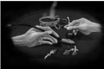
Herbes aromatiques nyssaliennes à base de champignon

Une bonne nouvelle pour tous nos lecteurs friands des spécialités nyssaliennes, les problèmes de qualité touchant certaines productions seraient en passe d'être réglés.