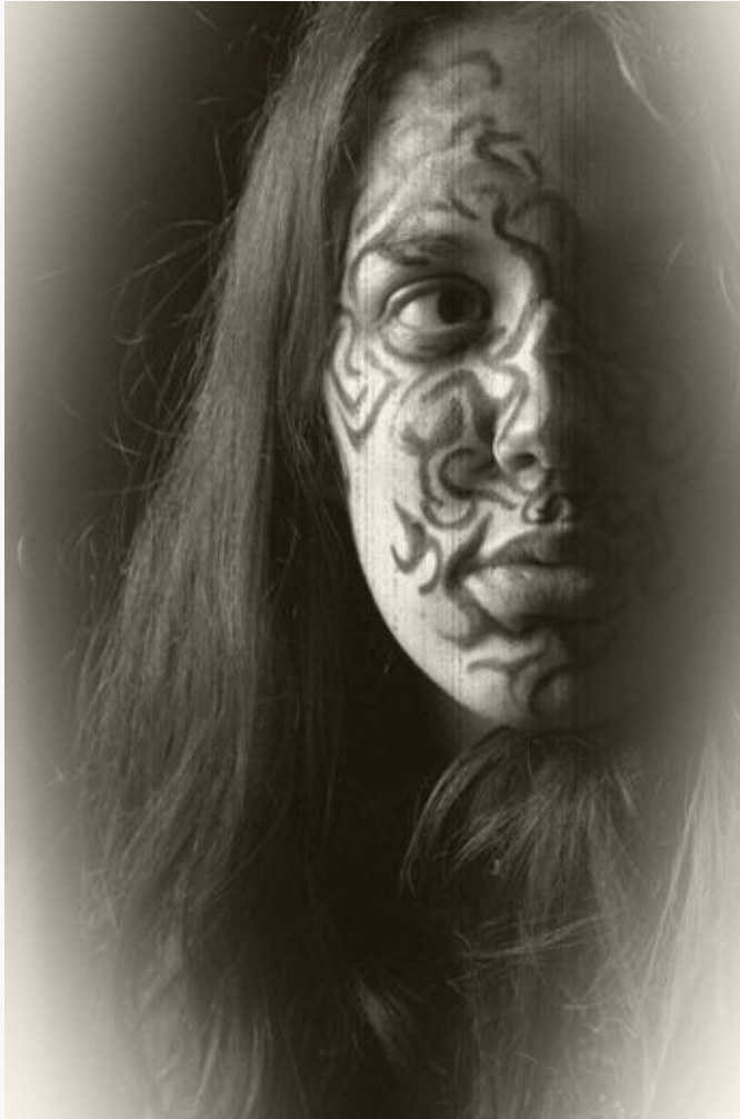
La regrettée Nefret Symphorine, grande prêtresse de Sofranne. Portrait de Guth Van Berg

Nous sommes bien sûr sous le choc de cette nouvelle qui vient d'être rendue officielle par le Conseil des Prêtresses.