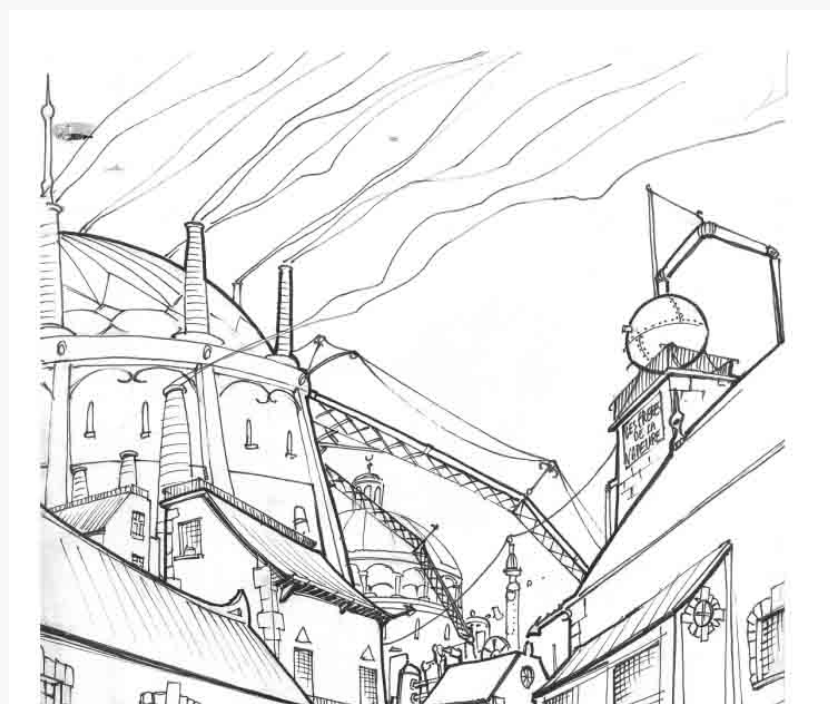
Croquis de la cité du savoir – par un de nos reporters lors d'un voyage précédent le siège.

On sait que des groupes de paysans sous forte escorte profitent des accalmies entre chaque escarmouche pour aller tirer le maximum des récoltes et tenter d'assurer l'approvisionnement. Mais on note également une raréfaction de la mélamentite dans les échanges commerciaux sur la totalité du territoire d'Erèbe. Rappelons que Marchev est le principal producteur de mélamentite, source d'énergie principale des appareils technologiques. Une telle pénurie ne peut qu'être annonciatrice de graves problèmes.