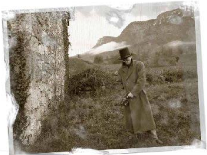
Croquis du célèbre da Vinço au cours de sa cavale par un de nos reporters

Nous ne disposons malheureusement que de peu d'éclairages scientifiques sur la probabilité d'une telle découverte. En effet, les scientifiques des plus grandes Universités de Marchev n'ont pu être contactés du fait du blocus engendré par les attaques de damnés sur la cité technologique.