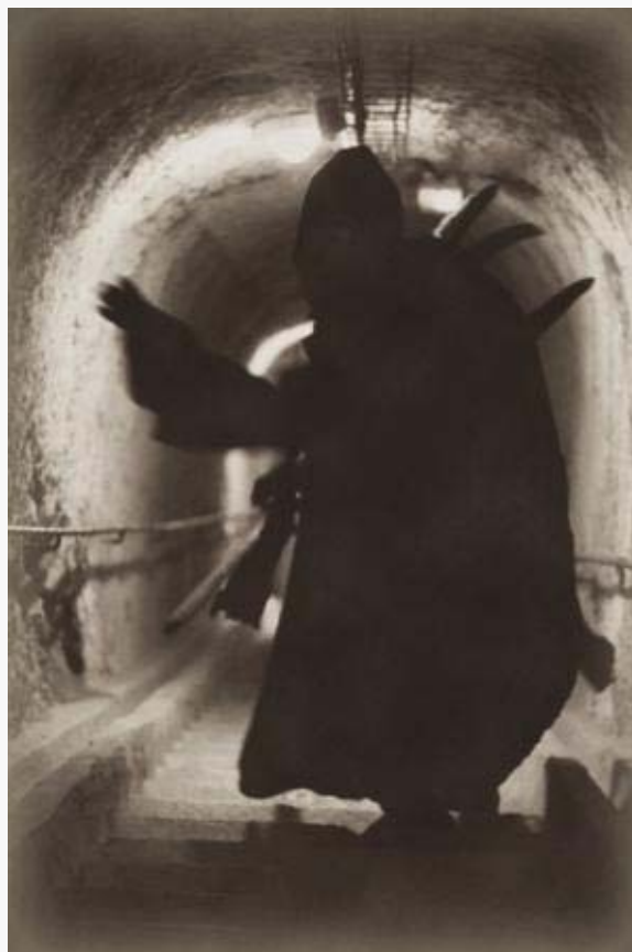
Croquis réalisé par notre valeureux reporter.

Les habitants des alentours du fort comme les invités se sont refusés à tout commentaire sur cet épisode. Mais au lendemain de l'incident, l'humeur était maussade et une oreille exercée pouvait saisir au vol les mots "mauvais présage" flotter comme l'un des relents nauséabonds qui accompagne ces horreurs.