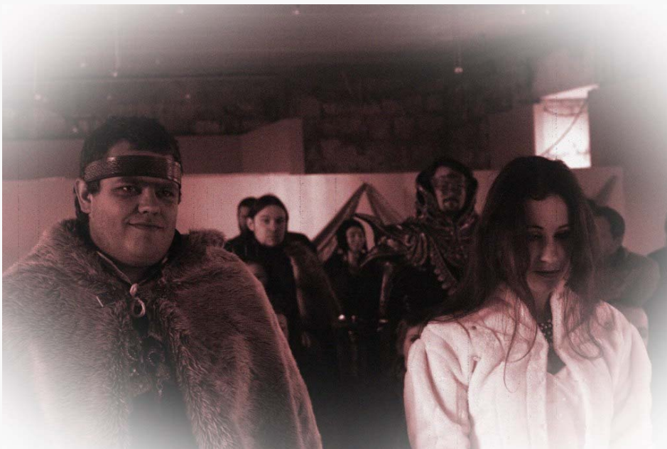
Les nouveaux mariés, devant l'autel

Alors que le malaise du réveil était dissipé par la science médicale, on apprenait qu'une part de la noblesse avait rejeté ses vœux de loyauté et s'apprêtait à assiéger le fort (voir notre article page 4). Cette rébellion ne parvint toutefois pas à briser le pouvoir royal, pas plus qu'à gâcher la cérémonie religieuse qui s'en suivit.