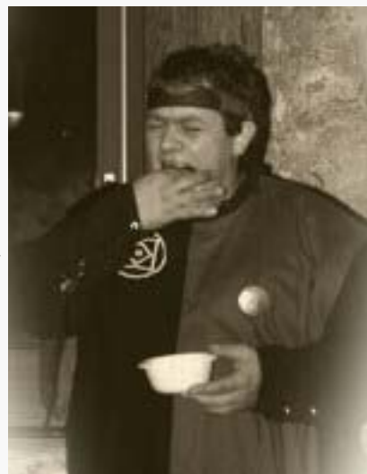
Le prince Jergen Vodenzâr, dévorant sa prise de chasse.