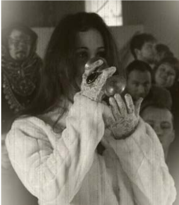
La Princesse Naïa di Valustra lors de son mariage. Portrait de notre reporter Guth von Berg

Évidemment, on ne se permet ce genre de confiance que dans l'entre-soi le plus intime (et après quelques verres d'un de ces excellents alcools silfinites levés à sa santé) et rien ne permet aujourd'hui d'affirmer avec certitude ce que devient la Princesse d'Arkhaïs.